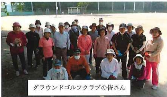
グラウンドゴルフクラブの皆さん

朝地町グラウンドゴルフクラブは現在会員38名、毎週火曜日と金曜日にグラウンドゴルフを楽しんでいます。また年4回大会を開催し（初打ち大会・新春大会・初春大会・紅葉大会）、会員相互の親睦を図るとともに豪華景品も楽しみのひとつです。新規加入大歓迎です。