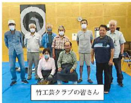
竹工芸クラブの皆さん