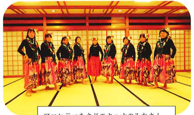
アロヒラニあさじモキハナのみなさん