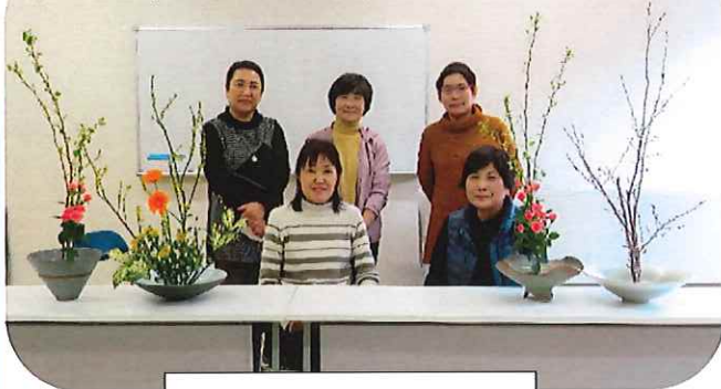
いけばなクラブのみなさん

いけばなクラブは会員 6 名。華道家元池坊教授の指導の下、毎月 2 回の教室を楽しみにしています。公民館フェスタでは、厳かな中にも華やかないけばなで皆さんの目を楽しませています。