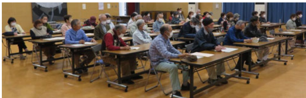
《合同開級式の様子》

学習会では、「性の多様性を認め合う～誰もが自分らしく生きられる社会をめざして～」をテーマに人権学習を開催しました。「自分らしく生きる」「互いの人権を尊重する」など性のあり方について考えるきっかけとなりました。