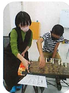
11/9 琴の音に親しもう