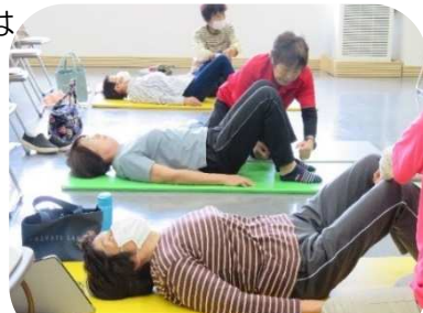
*お互いの足の様子をチェックする参加者

「体を動かしていないことがよくわかった。日常の動作を意識しようと思った。」「大変楽しく自分の体のチェックができた。足のチェックは勉強になった。」などの感想がありとても好評でした。