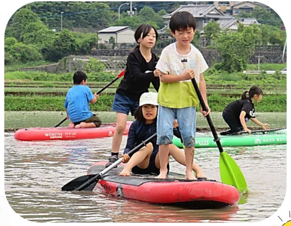
田んぼでSUP(サップ)を楽しむ子どもたち

6/10(土) 放課後チャレンジ事業千歳っ子で「水上スポーツのたちこぎボード(SUP)」を水田で体験しました。たくさんの方のご協力のおかげで子どもたちのSUP体験が実現できました。当日は、水を張った田んぼに子どもたちの大きな歓声があがりました。*大分合同新聞(6/17)や千歳支所のホームページに紹介されています。ケーブルTVでも6/30から放送予定です。