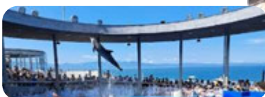
ウミガメの甲羅の背負い体験

海の生き物をたっぷり楽しんだ一日でした。子どもたちにとっての一番の思い出は真夏のなか、水しぶきよけのカップを着用して観た「イルカショー」だったようです。