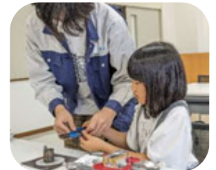
「科学と遊ぼう」! 大分高専のお兄さん、お姉さんと実験!