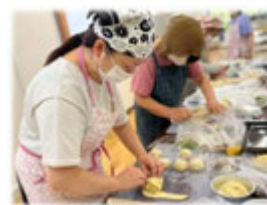
ホクホクのじゃがいもを 包んでいきます