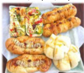
焼きたてのパン、どれもおいしそう