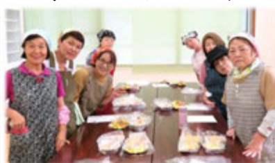
9月25日参加の皆さん