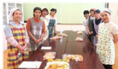
9月18日参加の皆さん