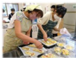
チーズなどをトッピング