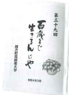
▲「百歳まで生きるんじゃ」の冊子

緒方町高齢者大学は、老人クラブ連合会緒方支部と連携し、現在約250人の学級生が在籍しています。今年も「百歳まで生きるんじゃ」第39回が3月11日に発刊されました。趣味の取り組みに関するもの、感謝の気持ちをつづったもの、現代社会への思いを19人の受講生が執筆されています。冊子は、各公民館図書室で閲覧することができます。