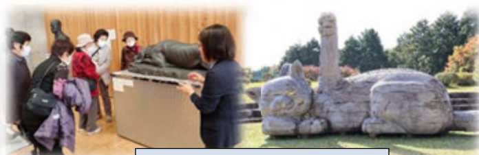
朝倉文夫記念館で館内見学