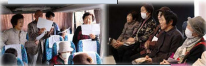
北里柴三郎記念館で館内見学