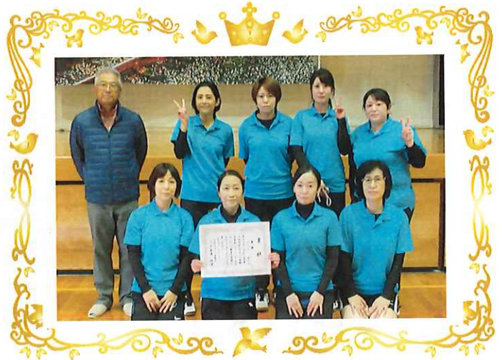
👑 優勝 アースチームの皆さん