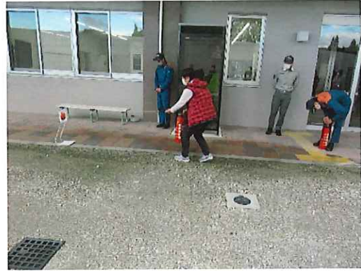
模擬消火器での消火訓練