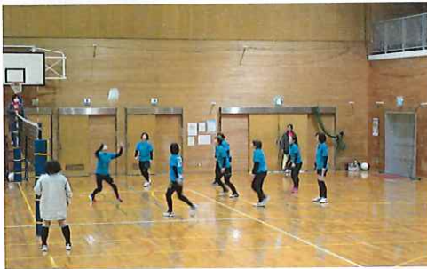
元気モリモリ、声かけて！ チームワークは、ばつぐんです。