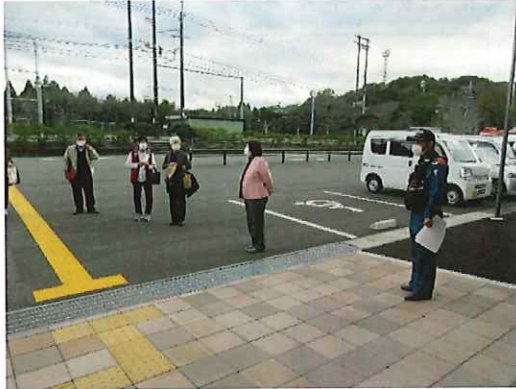
館長（管理権原者）からの訓練評価

また、会議終了後に豊後大野市消防本部東分署が立ち合いのうえで消防訓練を実施しました。施設内の「男子休憩室」から火事が発生した想定で「通報・初期消火・避難誘導」を行いました。学級長の皆さんは、館内放送と避難誘導者（職員）の指示に従い、館外の避難場所へ速やかに移動（避難）しました。避難点呼後、今度は、模擬（水）消火器を使った消火訓練を行いました。消防署員から消火器の使い方を指導してもらい、実際に的をめがけて放水（消火）する訓練を行いました。公民館の消防訓練は、今後も継続して行い、練度を上げていきたいと思えます。