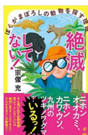
「絶滅してない！ぼくがま ぼろしの動物を探す理由」 宗像充