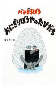
「パンどろぼうおにぎり ぼうやのたびだち」 柴田ケイコ