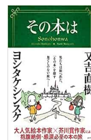
「その本は」 又吉直樹 ヨシタケシンスケ