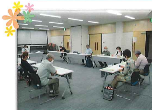
9月29日開催の第1回会議の様子

今回の主な議題は、今後の公民館を運営する上での資料とさせていただくことを目的に実施する標記の町民アンケートについてでした。協議の結果一部内容の見直しを行ったうえで実施が承認されました。2月1日付け自治委員文書で全世帯に配布いたします。設問は10問で簡単な内容となっていますので、ご記入の上2月28日までに自治委員さんまでご提出お願いいたします。