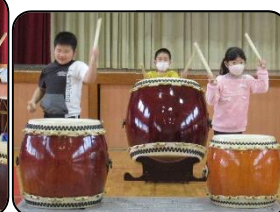
【 様になってるネ! 】