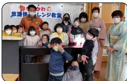
【 茶道体験 】

※令和4年度のチャレンジ教室も残すところ2月と3月で終了となります。子ども達の成長した姿をおいでになってご覧下さい!