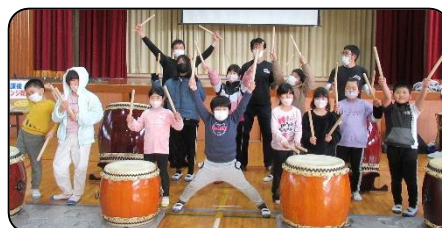
【 和太鼓体験 】