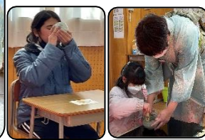
【 上手に出来ました! 】