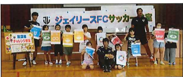
笑顔いっぱいのサッカー教室♪