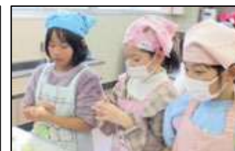
【おやつクッキング】