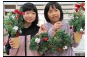
【フラワーアレンジメント】