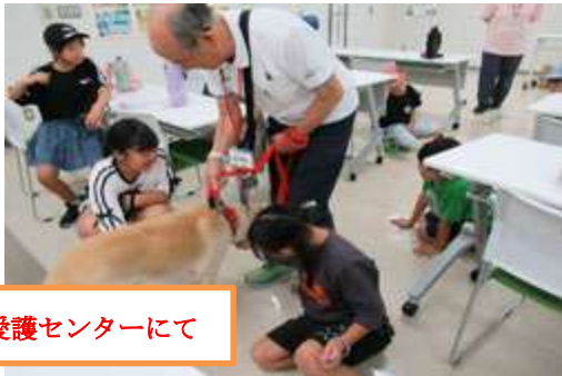
動物愛護センターにて