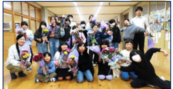
▲12/17 フラワーアレンジメント