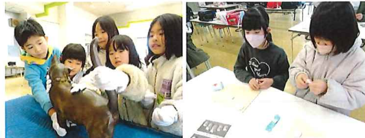
2/12 朝倉文夫記念館出前講座