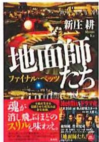
地面師たち ファイナル・バンツ/新庄耕