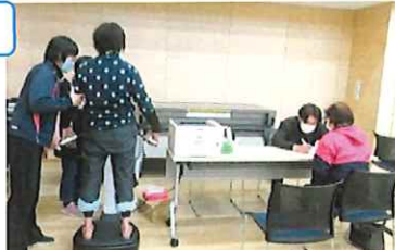
天心堂のインボディ測定