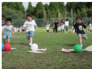
↑ 昨年度の「スポーツレクリエーション祭」の様子