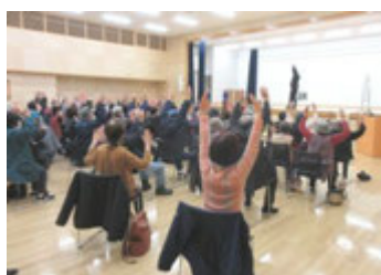
↑ 昨年度の「スポーツ医科学講座」

5月15日(木)に大野町スポーツ振興会総会が行われ、今年度の活動計画が決定しました。 各行事開催前にチラシや公民館だよりでお知らせしますので、ぜひご参加ください！