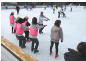
← 昨年度の「スケート教室」の様子