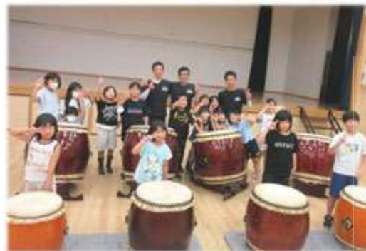
9月10日(水):和太鼓体験教室