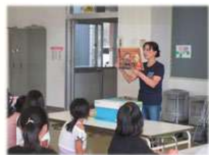
9月3日(水):読み語り・工作