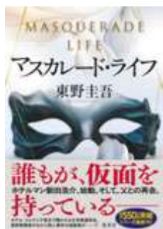
マスカレード・ライフ /東野圭吾