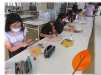
9月17日(水):工作(しおり作り)・宿題