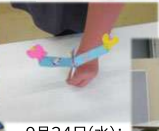
9月24日(水): 工作(紙コプター)・宿題