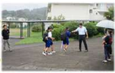
中学部では校長先生と グータッチ♪