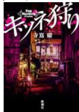
キツネ狩り/寺島曜