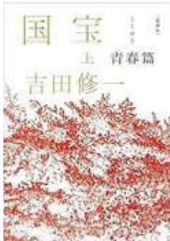
国宝 愛蔵版(上・下)/吉田修一