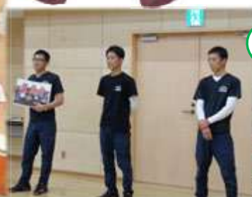
先生は「豊勇會」のみなさん