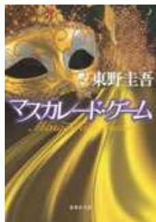
マスカレード・ゲーム 文庫本/東野圭吾